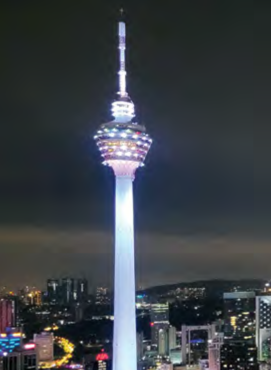
1996 KL Tower – 421 M