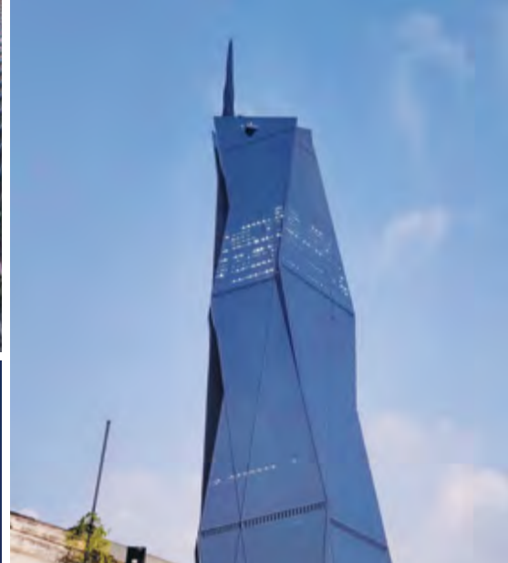
2024 Merdeka118 - 678 M