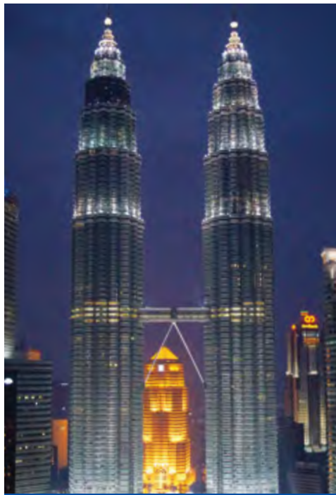
1998 Petronas Twin Towers - 452 M